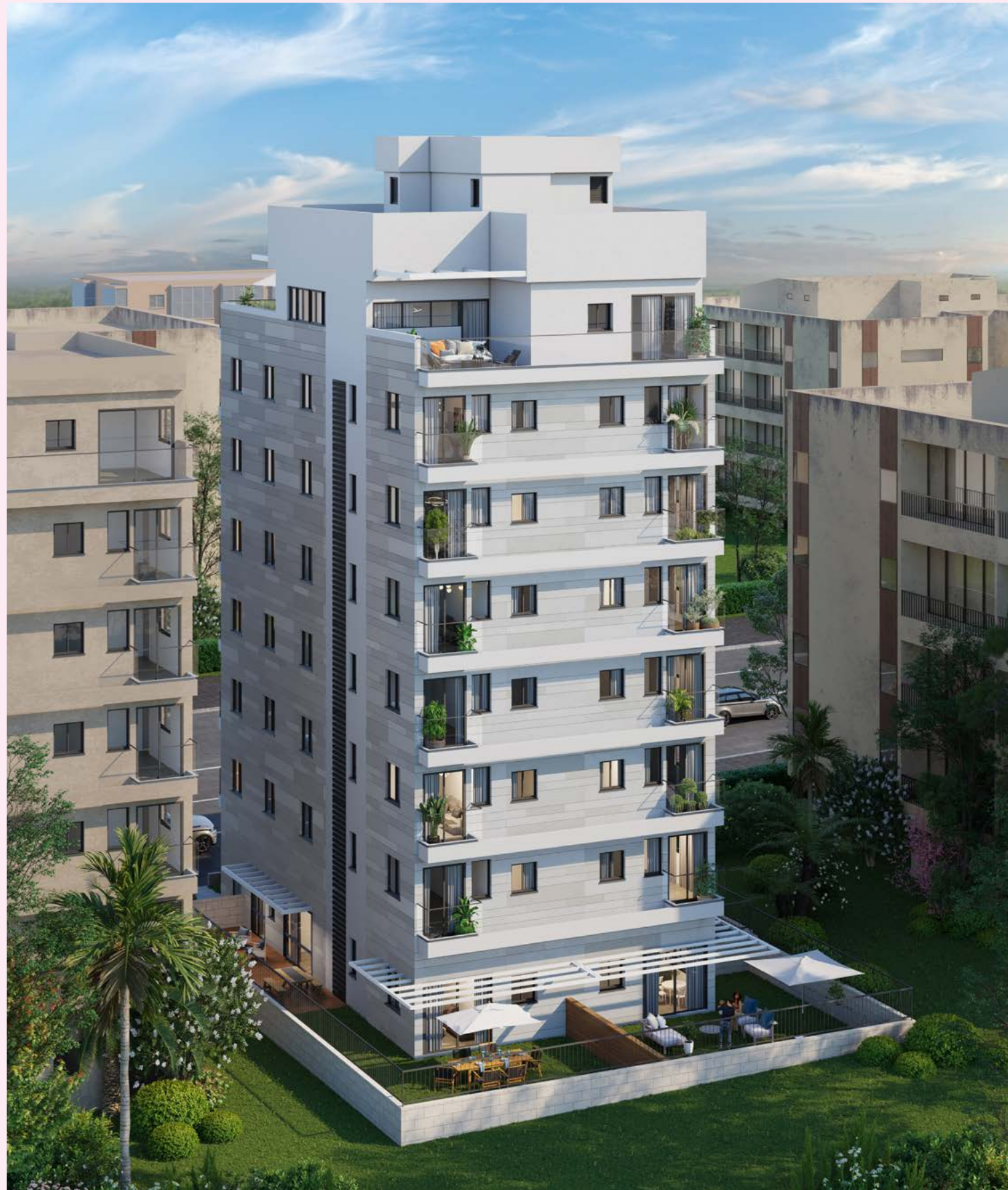
מבט לעורף הבניין